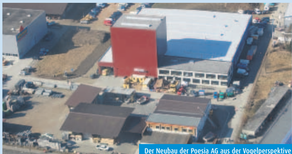
Der Neubau der Poesia AG aus der Vogelperspektive