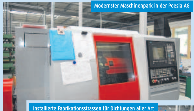
Moderner Maschinenpark in der Poesia AG