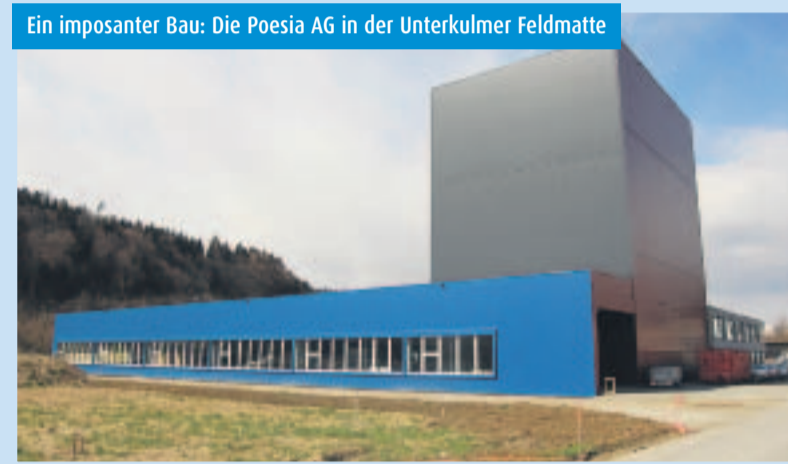
Ein imposanter Bau: Die Poesia AG in der Unterkulmer Feldmatte

Das Poesia-Führungsteam setzt sich täglich mit bewährten und neuen Produktionstechniken auseinander – immer mit dem Ziel, eine anspruchsvolle Kundschaft in ihrem Erfolg zu unterstützen. Ein Lager mit über 1'800 Dichtungsprofilen, die Beschaffung von besonderen Dichtungen, der Verkauf und die Vermietung von Maschinen, Werkzeugen und Klebstoffen gehören genauso ins Poesia-Angebot wie eine vorbildlich organisierte Logistik, die Polymerverarbeitung im eigenen Extrudierwerk oder aber die Herstellung und der Vertrieb von Gewindebüchsen sowie der Bau von Formen und Einrichtungen für die Herstellung von Dichtungsprofilen. In diesem Bereich heisst der erfolgreiche Firmenslogan «Von der Gewindebüchse zum Designerprodukt». Die Dichtungsspezialisten der Poesia-Gruppe haben für jeden Bedarf die richtige Lösung und sind auf kleinere Serien oder auch Einzelanfertigungen spezialisiert, die in Grosskonzernen schlicht und einfach nicht erhältlich sind oder zu vertretbaren Kosten nicht produziert werden können. «Poesia» ist das Zauberwort für eine unglaubliche Flexibilität im Dichtungsbereich. Der übrigens aus dem lateinischen stammende Firmenname (poesie = dichten, Poesia = Dichtung) erklärt auf elegante Weise das wichtige Produktionsfeld der Firmengruppe. Das ausgesprochen hohe Leistungsniveau hat nicht nur die Schweizer Kundschaft erkannt, wie es ein bemerkenswerter Exportanteil täglich beweist.