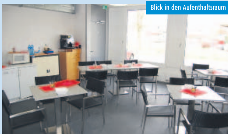
Blick in den Aufenthaltsraum

Das beinahe 25 Meter hohe Hochregallager (HRL) war vor allem für den Stahlbauingenieur eine Herausforderung, welche dieser raffiniert meisterte. Massive, horizontal liegende Stahlrahmen aus IN-Profilen, sowie zwei riesige Bogenkonstruktionen ermöglichten den vereinfachten Aufbau des hohen Turmes. Anspruchsvoll war aber auch die Planung des Brandschutzes. So wurde das HRL beispielsweise während der Baubewilligungsphase in seiner Höhe reduziert, damit der hohe Baukörper nicht mehr als «Hochhaus» klassifiziert wird, und mit reduzierten Brandschutzauflagen geplant werden durfte. Die Decke der Produktionshalle unmittelbar beim HRL musste in einer Tiefe von mindestens 5 Meter als Beton-Verbunddecke ausgeführt werden, damit Feuer weder von Oben noch von Unten zu schnell seinen Weg findet. Sämtliche Bauten mit Ausnahme des Büros werden schlussendlich durch eine Sprinkleranlage im Brandfall geschützt.