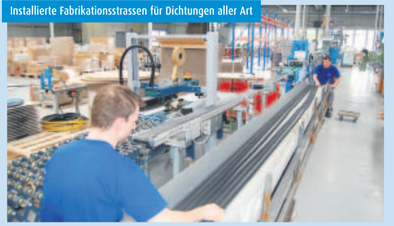
Installierte Fabrikationsstrassen für Dichtungen aller Art