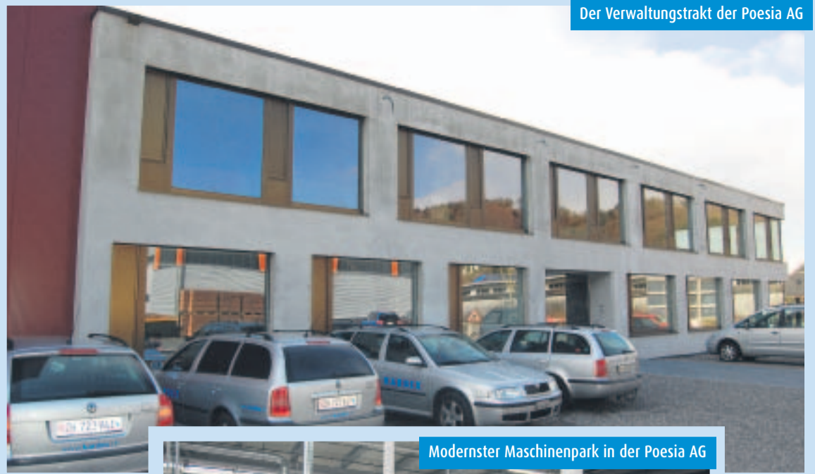
Der Verwaltungstrakt der Poesia AG